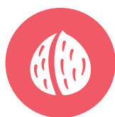
NUTS FRUTOS DE CÁSCARA